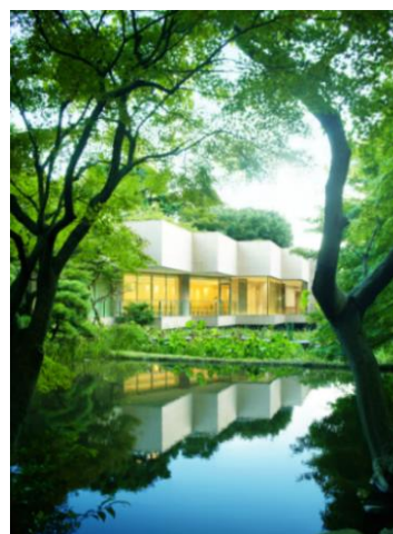
チャペル ザ・フォレスト