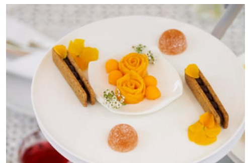
スイーツ イメージ