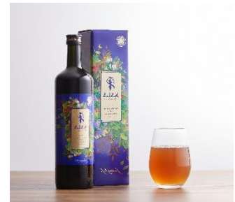
酵素ドリンクイメージ

品川御殿山に位置する当ホテルは、都心にありながら緑豊かな御殿山庭園に囲まれており、当プラン専用のウォーキングMAPにて、リラックス気分を味わいながら庭園を散策することで、ストレスなくファスティングを実施いただけます。また、ホテル内フィットネスルームもご自由に利用でき、快適な環境の中で確実なファスティングが可能です。