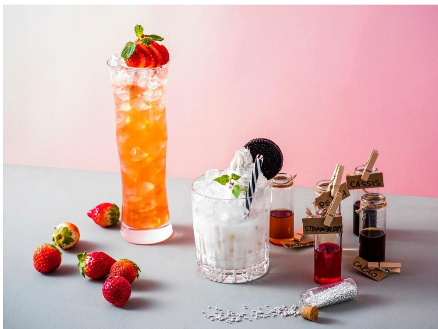
冬を彩るカクテル「ベリッチ」(左)、「ホワイト ウィッシュ」(右)

東京マリオットホテル(東京都品川区 総支配人:飯田雄介)では、2017年12月26日(火)～2018年2月28日(水)までの期間、冬を彩るフォトジェニックなカクテルを、ホテル1階「ラウンジ&ダイニング G」にて提供します。自分好みの味にアレンジできるチーズケーキをイメージしたカクテルや、甘酸っぱい苺を使ったスイートなカクテルなど、独創性豊かなバーテンダーによるアートのような一杯で、心温まるひとときをお楽しみください。