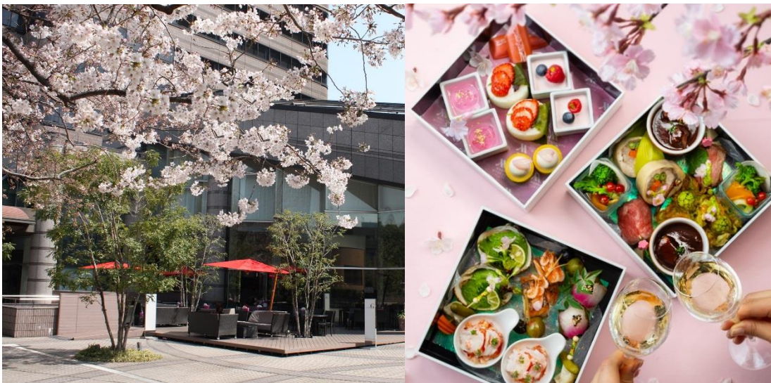
(写真左より) SAKURA テラス・Gotenyama “SAKURA” Moment

東京マリオットホテル(東京都品川区 総支配人:飯田雄介)では、2019年3月1日（金）～4月26日（金）までの期間、春のランチメニュー『Gotenyama “SAKURA” Moment (御殿山 桜モーメント)』を、ホテル1階レストラン ラウンジ&ダイニング Gの屋外「SAKURA テラス」で提供いたします。本メニューでは、ホワイトカラーがスタイリッシュな三段重に色鮮やかに詰められたマリオットオリジナルのモダンな特別メニューをお楽しみいただけます。葛飾北斎などの浮世絵にも描かれてきた風光明媚な御殿山で、桜の季節ならではの優雅なランチタイムを心ゆくまでお過ごしください。