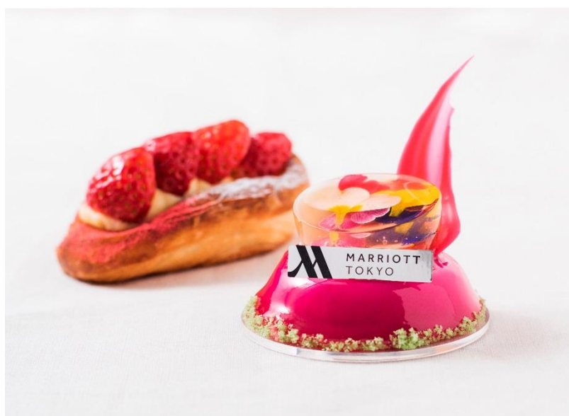
(左) 苺のデニッシュ、(右) エディブルフラワーと苺のムース