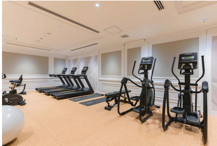
フィットネスルーム イメージ

東京マリオットホテル 身体を動かし、整える フィットネス アンド リラクゼーション 宿泊プラン「 Fitness & Relaxationプラン 」を発売 フィットネスルームオープン記念 期間：2022年1月11日(火)～12月31日(土)