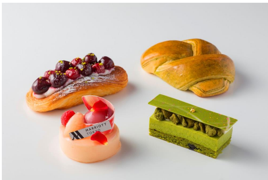
(左上) Wチェリー デニッシュ、(右ト) 結び (左下) アムール、(右下) 和み

東京マリオットホテル(東京都品川区 総支配人:飯田雄介)では、2018年5月1日（火）～6月30日（土）までの期間、初夏を彩るスイーツやブレッドをホテル1階「ペストリー&ベーカリー GGCo. (ジージーコー)」にて販売します。ジュンブライドをイメージした華やかで上品なスイーツや、結ぶ“絆”を表した京都宇治抹茶のブレッドなど、“eternal bond=永遠の絆”をテーマにした品が店頭に登場。そのほかにもチェリーをふんだんに使ったデニッシュや抹茶が香るムースといった、新緑がまぶしい爽やかな季節にぴったりのアイテムをお届けします。