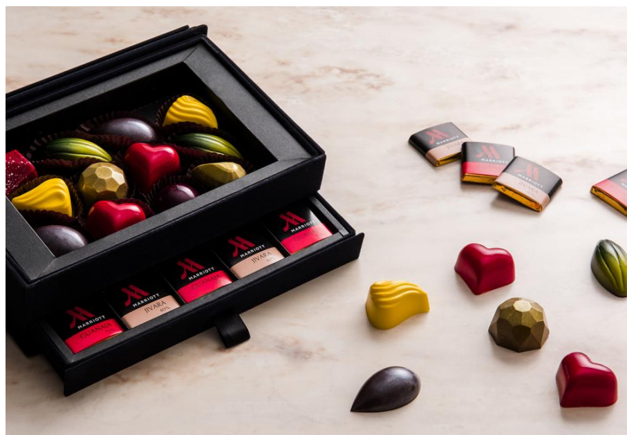
ブリリアント ショコラ ボックス

東京マリオットホテル（東京都品川区 総支配人：飯田雄介）では、2017年2月1日（水）より2月14日（火）まで1階「ペストリー&ベーカリーGGCo.」（ジージーコー）にてバレンタインシーズンを華やかに彩る珠玉のチョコレートギフトを販売します。“ Brilliant Moment with Dearest ”をテーマに、一粒一粒がまばゆいきらめきを放つボンボンショコラとフランス産「ヴァローナ社」キャレを詰め合わせた2段からなるラグジュアリーなショコラボックスや、まるで本物のコスメのようなチョコレートなど、大人の遊び心があふれるマリオットスタイルでお届けします。