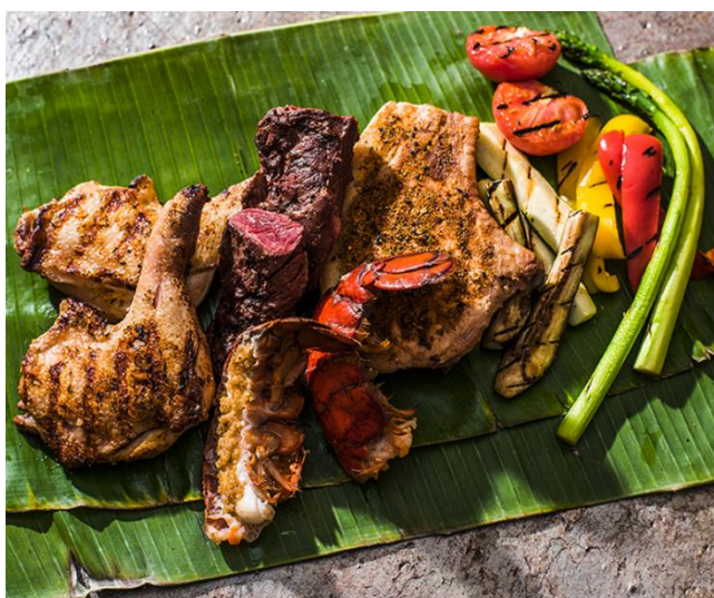
ハワイアン コンボ ディナー（イメージ）