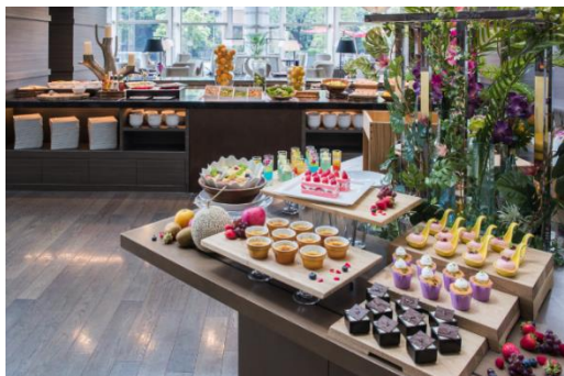
ウィークエンドランチbuffet (イメージ)

開放感あふれるアトリウムにて厳選したハワイ食材やトロピカルフルーツをふんだんに使用したメニューでお届けします。ワイコロアビーチ マリオット リゾート&スパ シェフ監修のメニューやカラフルな前菜、フォトジェニックなスイーツに至るまで、ハワイへショートトリップしたかのようなリゾート気分の一ときをお楽しみください。