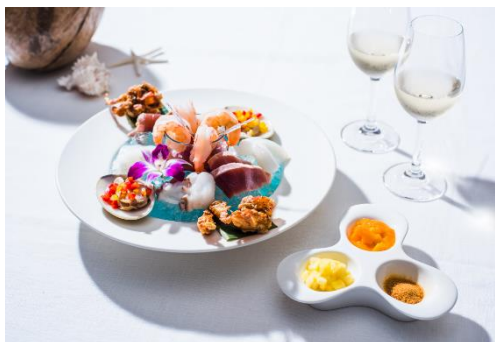
シーフードプラッター

東京マリオットホテルのシグネチャーディナーがハワイアンスタイルで登場。トロピカルオーシャンをイメージしたシーフードプラッターの前菜や、提供時にサプライズ感のあるダイナミックなグリルの盛り合わせ（表紙画像左）など、本場さながらに皆さままでシェアしてお楽しみいただけます。