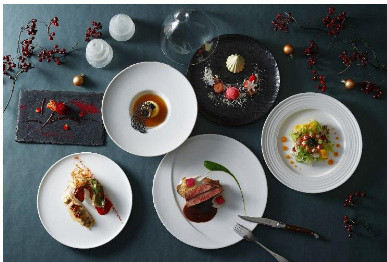
G's GRILL DINNER COURSE -Christmas- イメージ