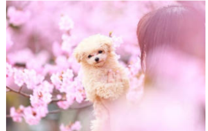
イメージ

ドッグフォトグラファー木村氏をお招きし、愛犬とのお花見を素敵な写真に残していただけます。フォトグラファーの撮影した写真は後日、データにてご参加の方にお送りいたします。