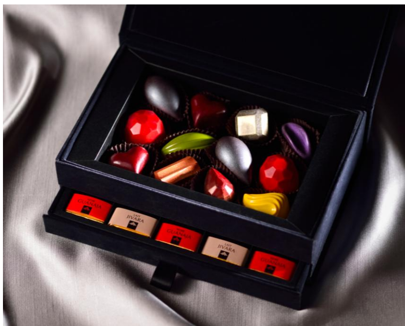
ジュエルチョコレートボックス「ビジュュー」

東京マリオットホテル（東京都品川区 総支配人：飯田雄介）では、「ペストリー&ベーカリー GGC Co.」（ジージーコー）にて、バレンタインギフトを販売します。“ Brilliant Jewels for Dearest ”をテーマに全3種をラインナップ。宝石のようにきらめくボンボンショコラとフランス「ヴァローナ社」のキャレを詰め合わせた2段のジュエリーボックス型ギフトに、風味豊かなチョコレートに真っ赤なフランボワーズをあわせたブラウニー、キュートなショコラマカロンなど、定番スイーツに遊び心を加えたマリオットスタイルで、バレンタインシーズンに彩りを添えます。