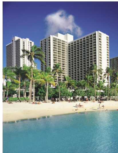
右) ハワイ ワイキキ・ビーチ・マリオット・リゾート&スパ