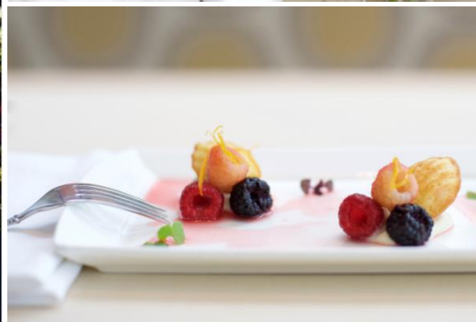
(左) プロモーション料理イメージ