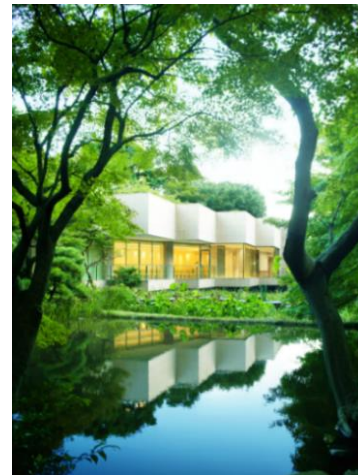
チャペル ザ・フォレスト