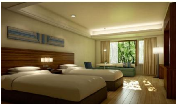
軽井沢マリオットホテル 客室イメージ

信州をテーマにお贈りする秋のキャンペーンとして、東京マリオットホテル LINE@公式アカウントに友達登録をしていただいた方の中から、軽井沢マリオットホテル（2016年7月29日オープン）の宿泊券を、期間中毎月一組の方にプレゼントいたします。