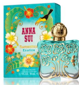
ANNA SUI エキゾティカ オーデトワレ