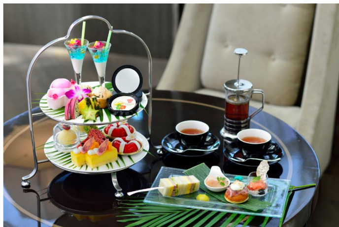
アイランドドリーム アフタヌーンティー&カクテル with ANNA SUI

東京マリオットホテル(東京都品川区 総支配人:飯田雄介)では、2016年8月1日(月)～11月30日(水)の期間で人気ファッションブランド「ANNA SUI」とのコラボレーション第二弾として、ホテル内レストラン「ラウンジ&ダイニングG」(1F)にて『アイランドドリーム アフタヌーンティー&カクテル with ANNA SUI』を開催いたします。昨年に続き、今年は日本上陸20周年を記念し更に色鮮やかに、新作フレグランス『ANNA SUI エキゾティカ オーデトワレ』の世界観をスイーツやカクテルで表現いたします。五感で楽しむ ANNA SUI のリゾートエクスペリエンスを、都心の緑を望み開放感あふれるホテルラウンジ空間の寛ぎとともにご堪能下さい。オーデトワレのミニボトル(4ml)をプレゼントいたします。