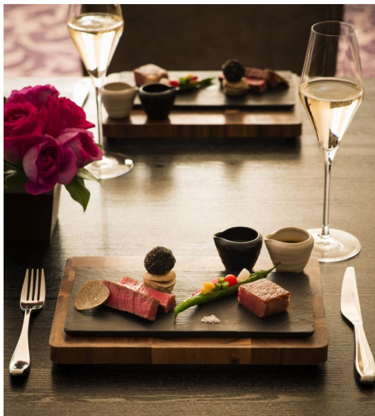
『プレシャスダイニング at G』イメージ

東京マリオットホテルでは、2014年12月26日（金）より2015年2月28日（土）まで、冬のレストランプロモーション『 Precious Moment with Dearest 』を開催します。ご夫婦や恋人同士で過ごすバレンタインデーに彩りを添えるプライベートディナーコースをはじめ、心弾む年始のパーティーにふさわしいレストラン仕立ての鍋料理など、大切な人と過ごす様々な冬のシーンに応える演出をお届けします。